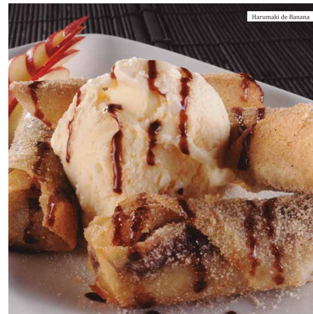
“EU SOU DÓCIL, MAS NÃO SOU FÁCIL”, DIZ HARUMAKI DE BANANA SOBRE OS ELOGIOS QUE RECEBE DIARIAMENTE.