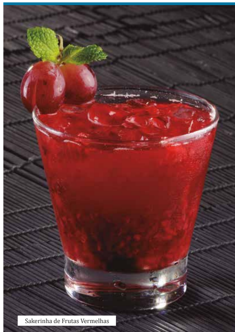
Sakerinha de Frutas Vermelhas